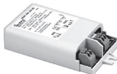
MINI MD BI